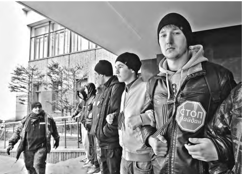
В Симферополе люди объединяются в дружины, чтобы не допустить беззакония по-киевски.