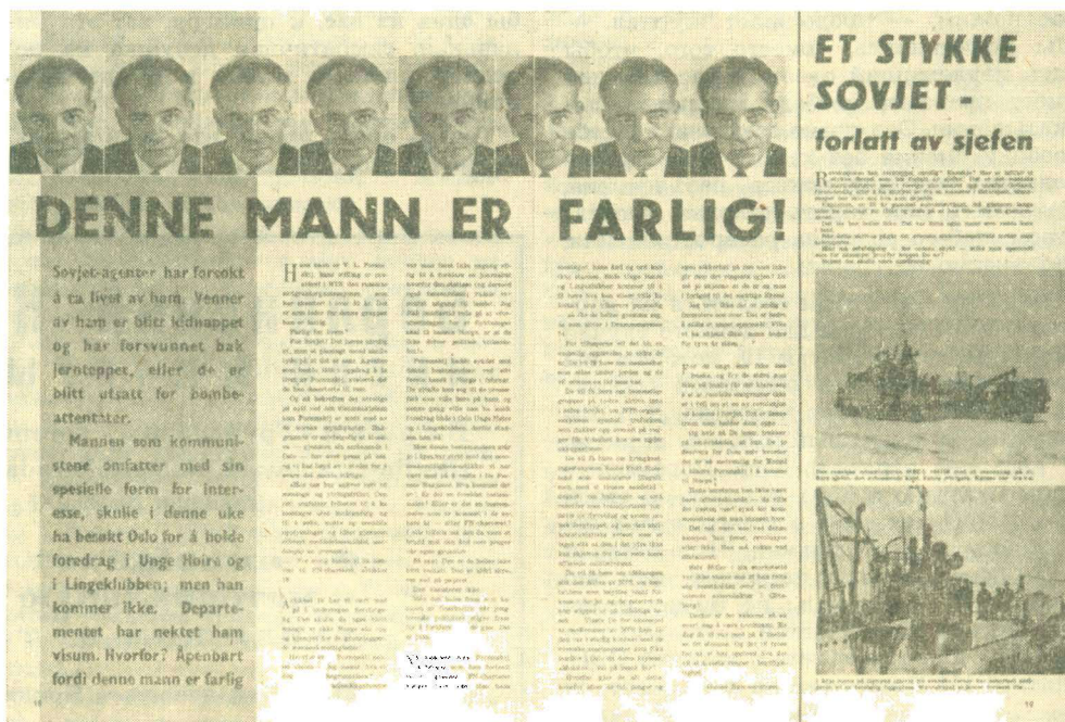
Страницы в норвежском иллюстрированном журнале «Нор», посвященные НТС. На снимках справа: советское судно «МБС-136150», молодой капитан которого попросил недавно политическое убежище у шведских властей