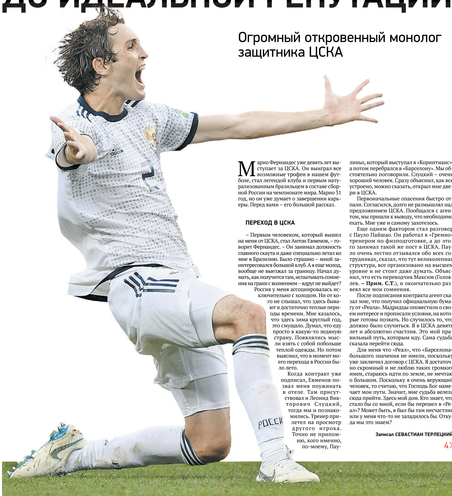
1 июля 2018 года. Москва. Лужники. 1/8 финала чемпионата мира. Испания – Россия – 1:1 (пен. – 3:4). Марио Фернандес празднует победу