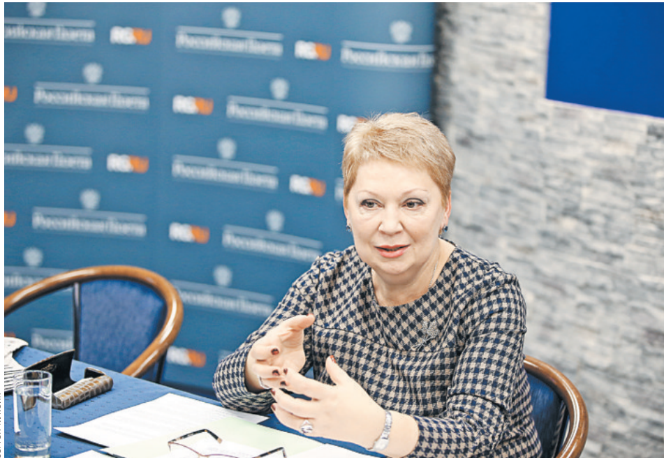
Ольга Васильева: Мы выстраиваем на всей территории страны единое образовательное пространство, с едиными стандартами качества. Начальная школа подошла к этому достаточно близко.

Я знаю про ажиотаж, про силу «сарфанного радио» среди родителей в выборе, как им кажется, «элитной» школы. Мы прикладываем много усилий, выстраиваем на всей территории страны единое образовательное пространство, с едиными стандартами качества для всех школ. Начальная школа подошла к этому достаточно близко: здесь мы уже первые в мире и по читательской грамотности, и по математике, и по естественно-научному направлению... Средняя школа—ситуация в регионах пока очень разная.