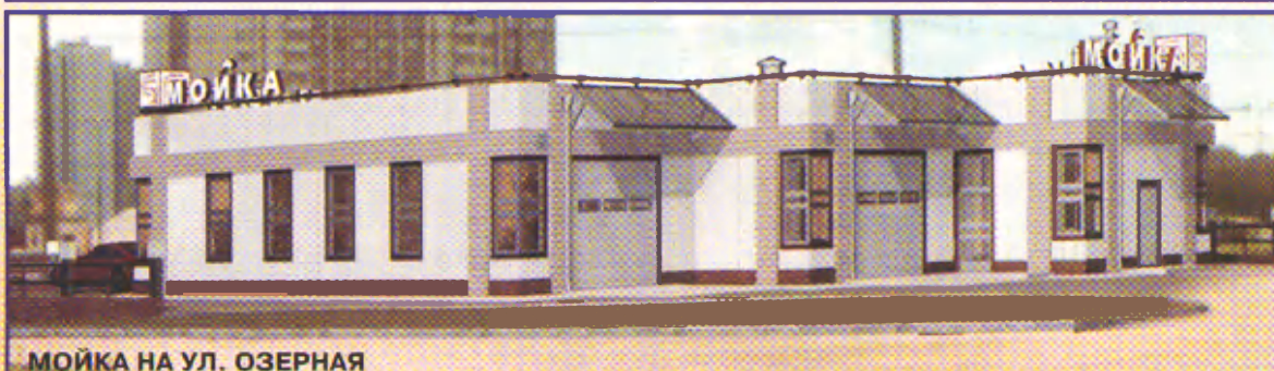
МОЙКА НА УЛ. ОЗЕРНАЯ