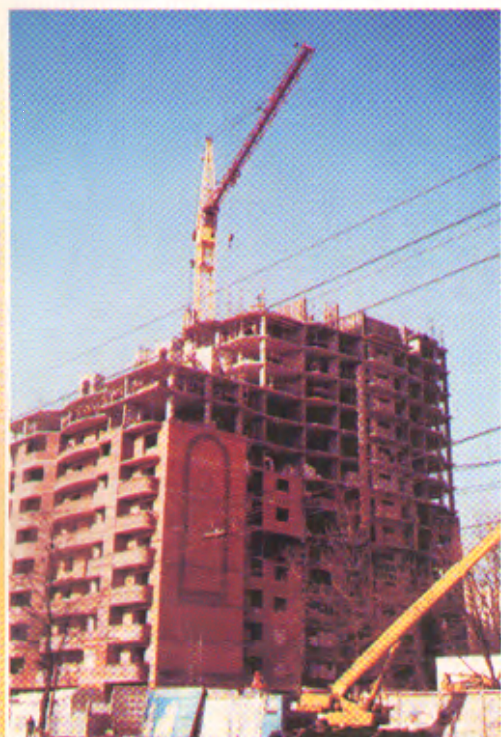
Строящееся здание в Коптево в Москве