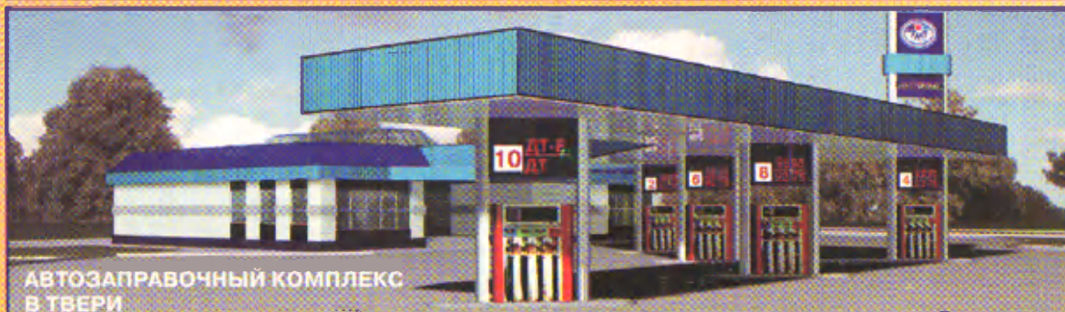
АВТОЗАПРАВочный КОМПЛЕКС В ТВЕРИ