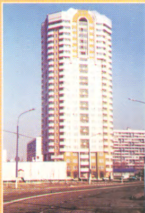
Построенное в алюминиевой опалубке здание на Братеевской улице. Строительная фирма «Главмонолитстрой»