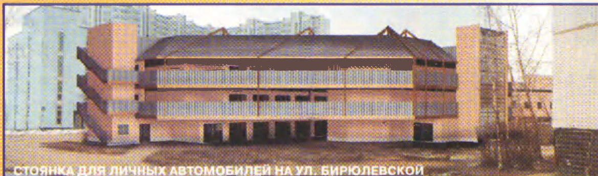
СТОЯНКА ДЛЯ ЛИЧНЫХ АВТОМОБИЛЕЙ НА УЛ. БИРЮЛЕВСКОЙ