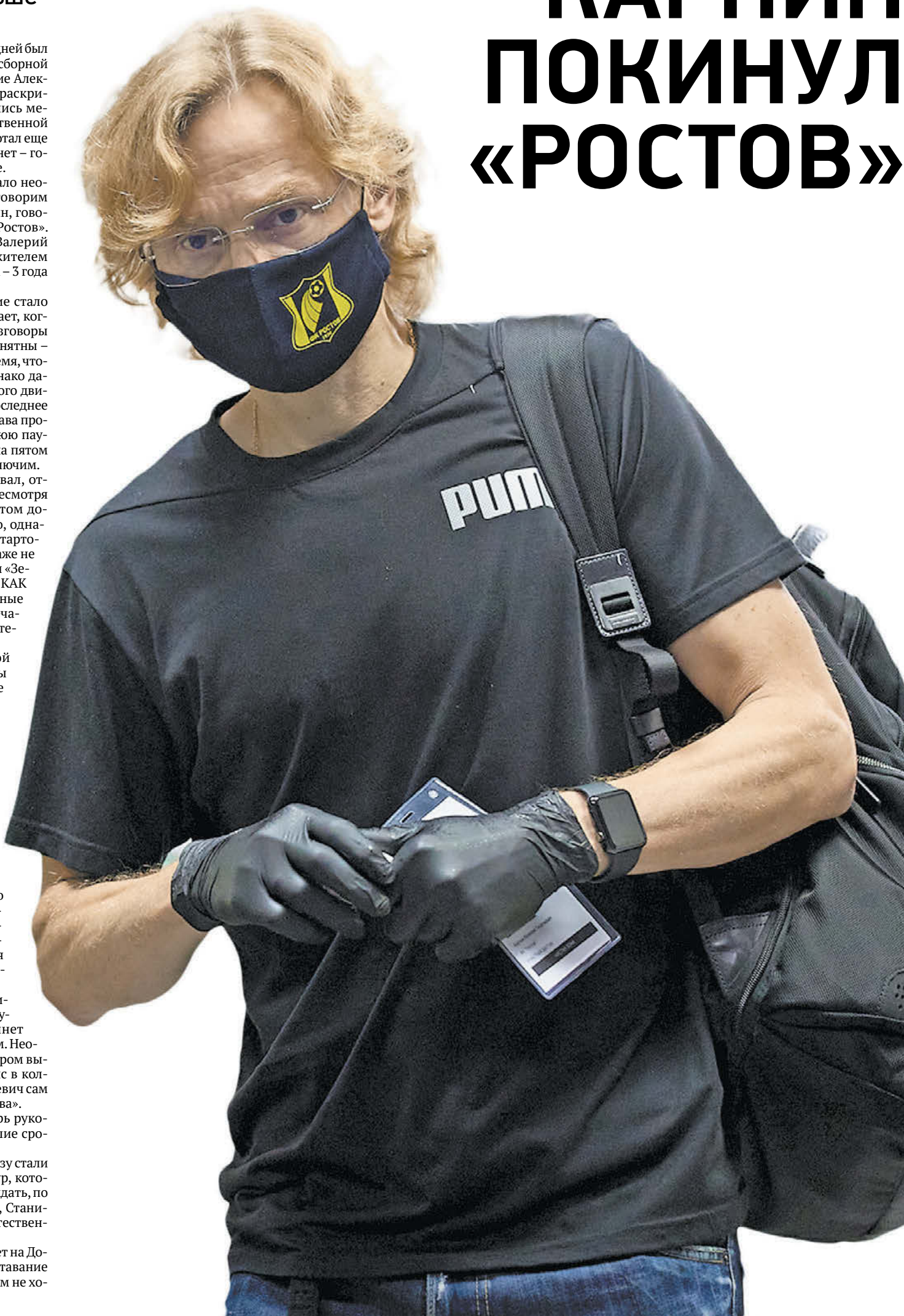
Теперь Валерий Карпин будет тренировать только сборную России