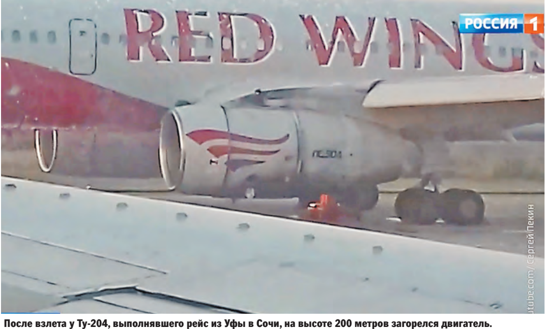
После взлета у Ту-204, выполнявшего рейс из Уфы в Сочи, на высоте 200 метров загорелся двигатель.