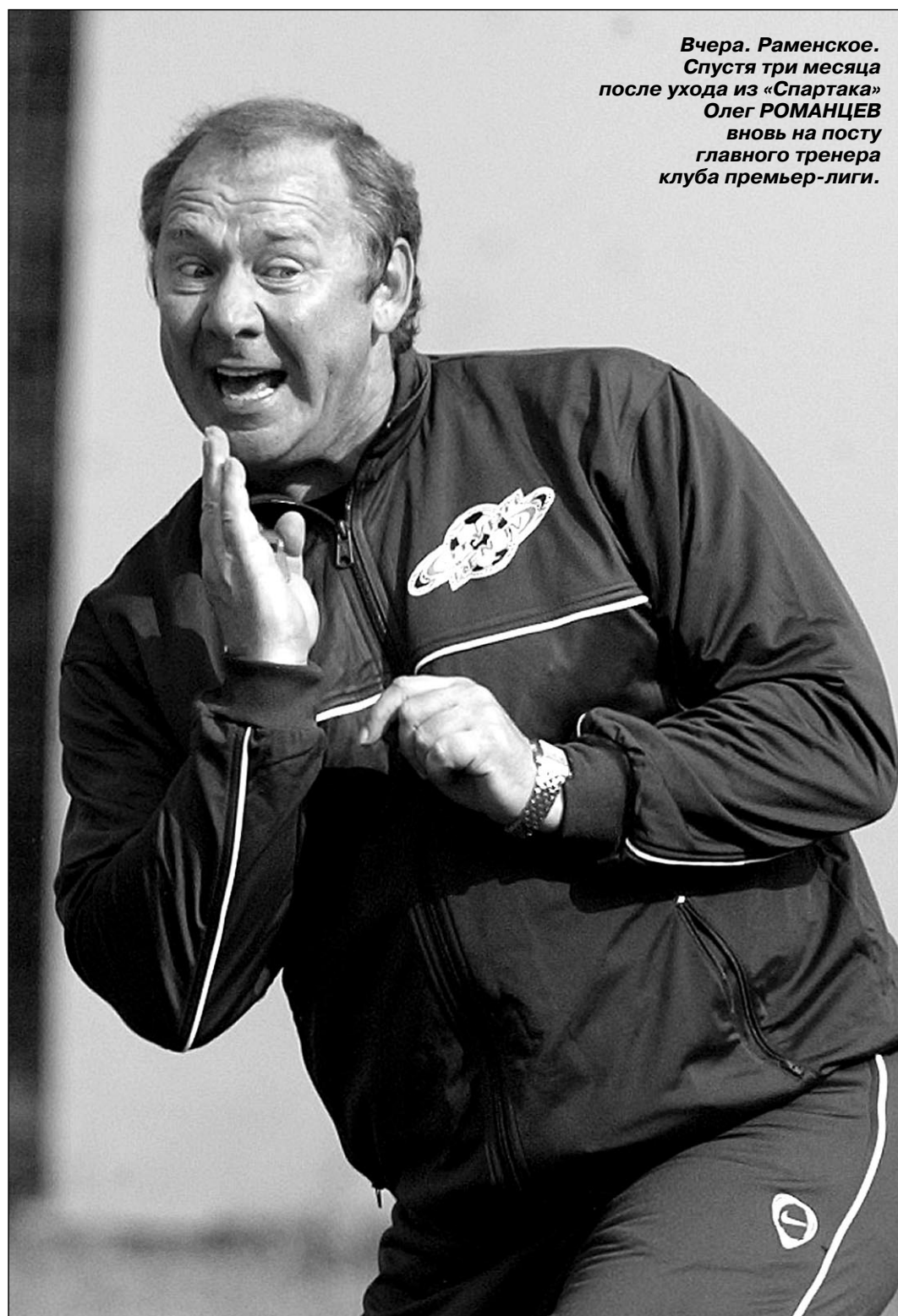
Вчера. Раменское. Спустил три месяца после ухода из «Спартaka» Олег РОМАНЦЕВ вновь на посту главного тренера клуба премьер-лиги.

Вчера Олег Романцев провел первую тренировку в качестве главного тренера «Сатурна», после чего ответил на вопросы журналистов