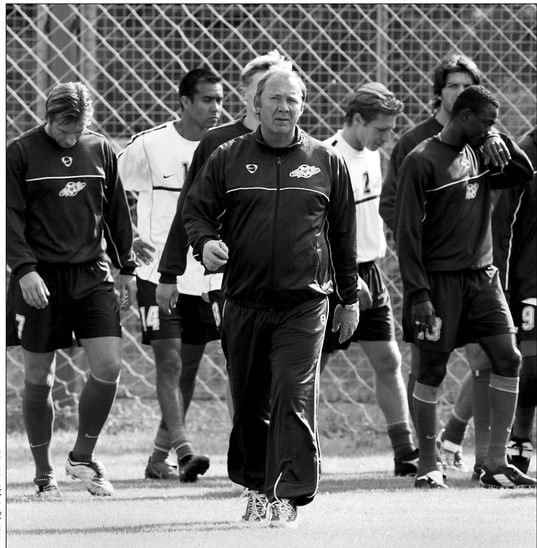
Олег РОМАНЦЕВ проводит первую тренировку в «Сатурне».

- Гарантировать, что «Сатурн» выиграет все оставшиеся матчи, сложно. В нынешней ситуации меня устроит, чтобы команда действовала с полной самоотдачей и показывала красивую игру.