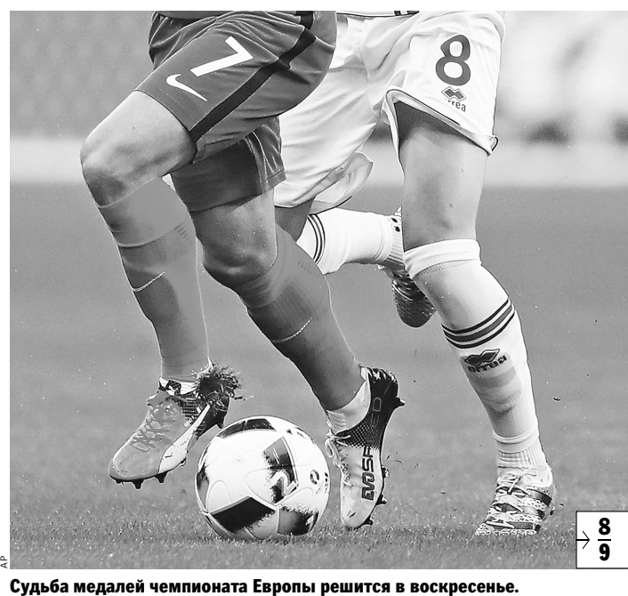
Судьба медалей чемпионата Европы решится в воскресенье.

Впервые в истории чемпионатов Европы будет вручено лишь 2 комплекта медалей: золото и серебро