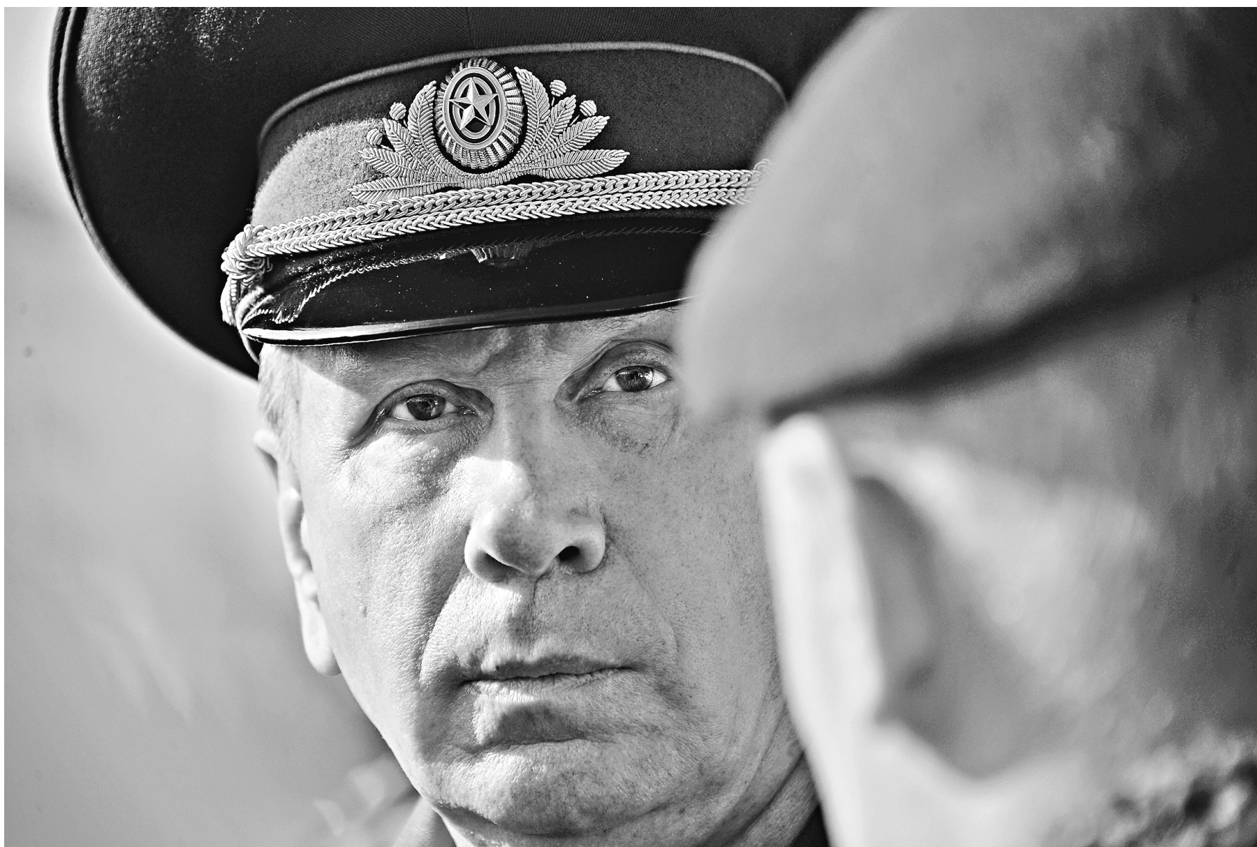
Новой силовой структурой управляет Виктор Золотов, директор федеральной службы — главнокомандующий войсками национальной гвардии.