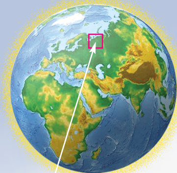
Ямало- Ненецкий округ