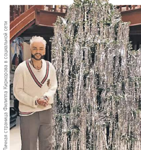
Личная страница Филиппа Киргорова в социальной сети