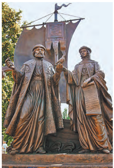
Такой памятник Петру и Февронии установлен в Самаре.

ник выпадает на Петров (он же Апостольский) пост, установленный в православных церквях в память о святых апостолах Петре и Павле. Начинается через неделю после Дня Святой Троицы, заканчивается 12