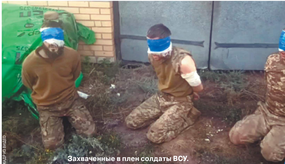
Захваченные в плен солдаты ВСУ.