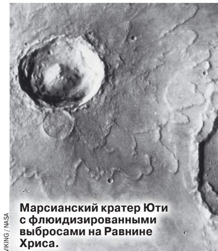
Марсианский кратер Юти с флюидизированными выбросами на Равнине Хриса.

Планетолог Базилевский: «Для обычных людей это — сенсация»