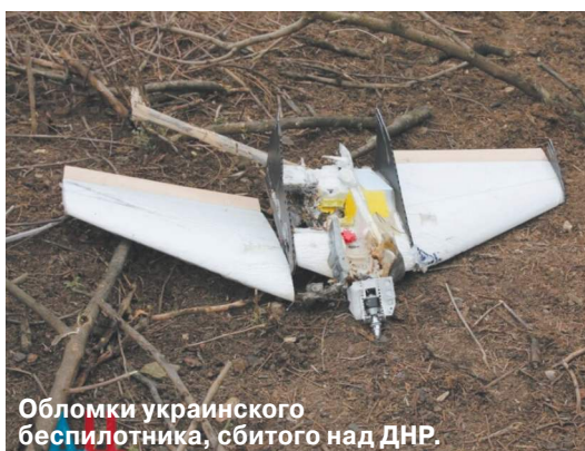
Обломки украинского беспилотника, сбитого над ДНР.

В ночь на 27 марта украинская сторона неожиданно сократила до минимума количество беспилотных атак по российским регионам. Некоторые связали этот факт с прошедшими в Эр-Рияде переговорами. По