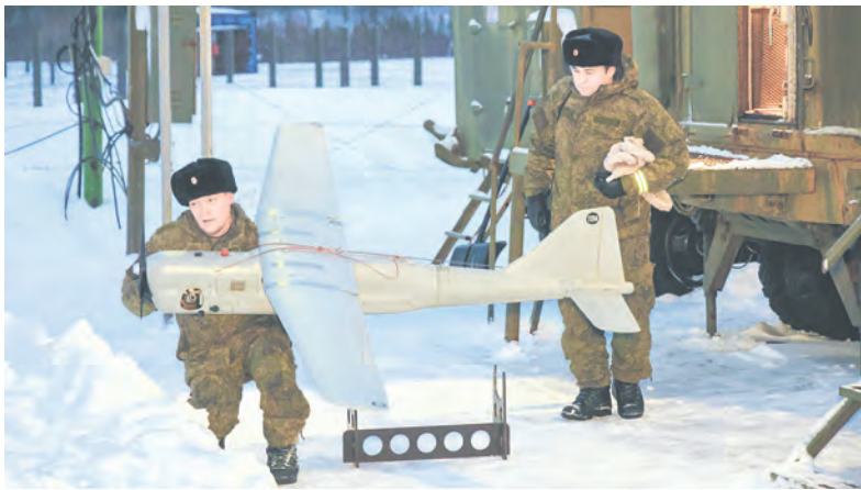
Чем меньше «птичка», тем меньше допуск.