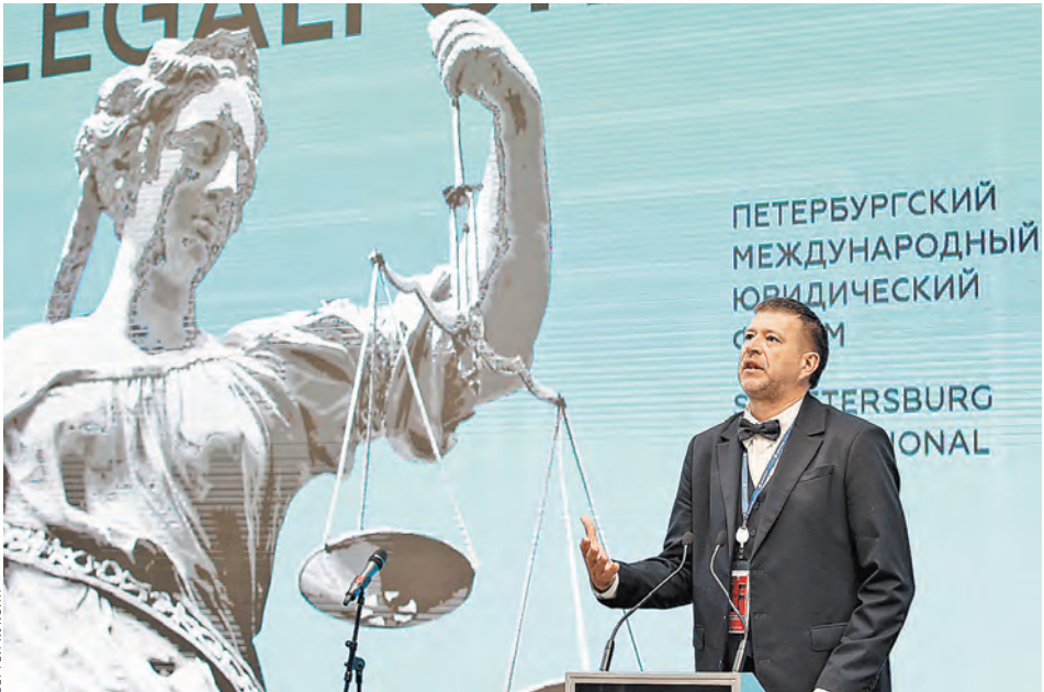
И.о. министра юстиции России Александр Коновалов рассказал о том, как развитие информационных технологий влияет на право.