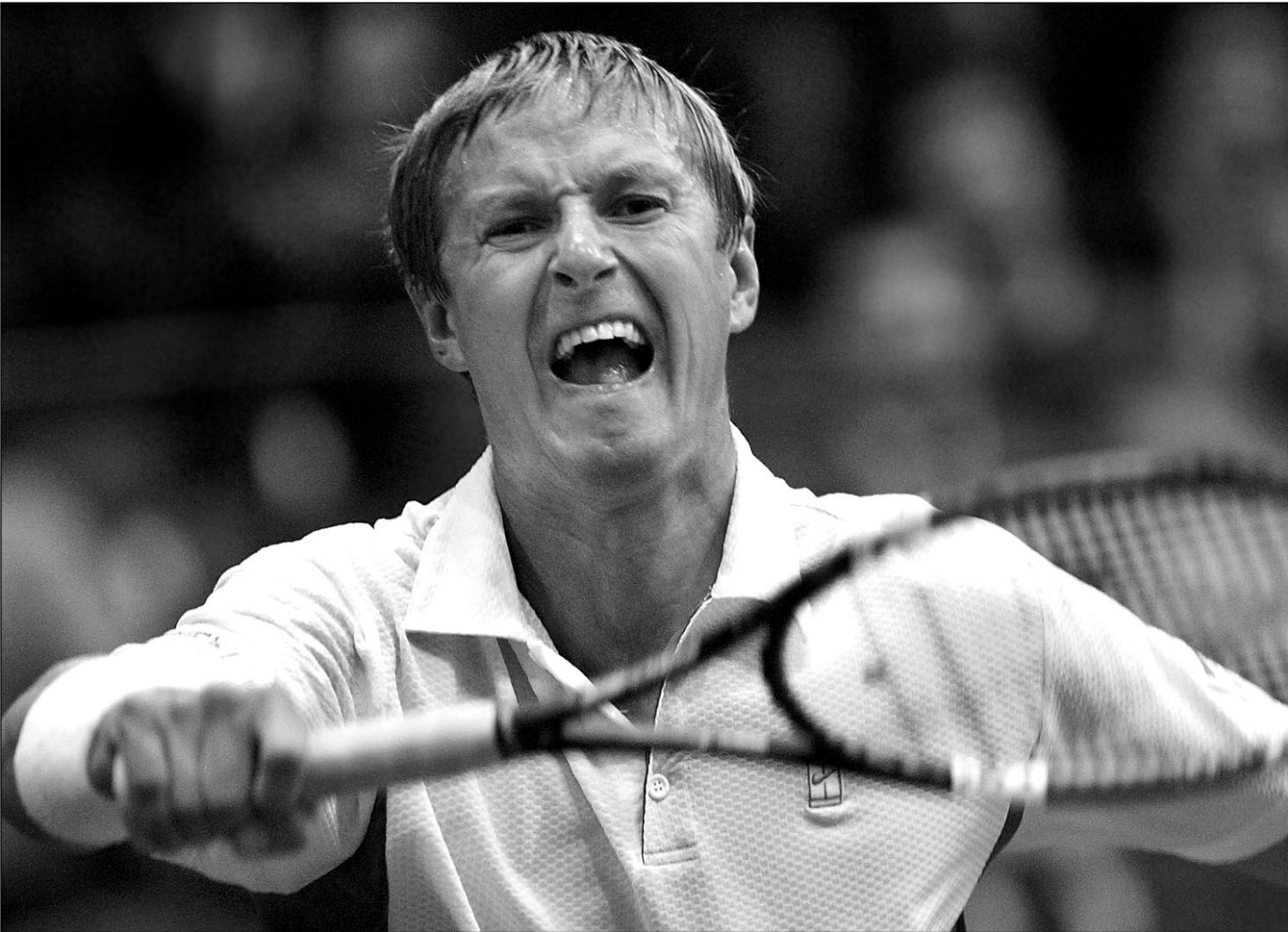
Вчера. Лужники. Евгений КАФЕЛЬНИКОВ побеждает Гастона Гаудио.