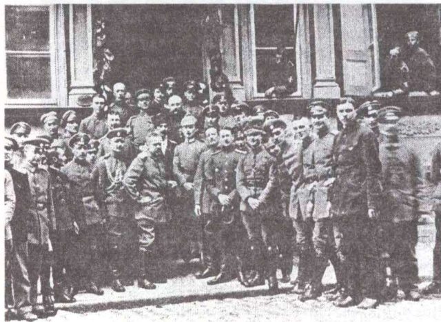
Штаб Западной Добровольческой армии Бермондта-Авалова.