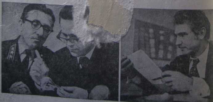
Текст М. Свердловой.

Совершенствуется учебный процесс. Учитываются мнения слушателей. Лекции сейчас более тесно связываются с практикой прокурорского надзора, в них уделяется большое внимание организации работы прокуратуры. После каждого выпуска результаты работы обсуждаются на совещании совета Высших курсов, директорате.