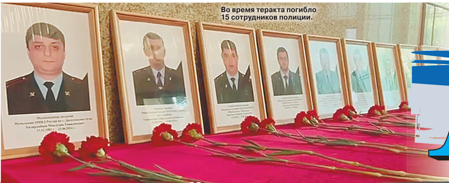
Во время теракта погибло 15 сотрудников полиции.