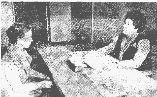
▲ На приеме граждан.