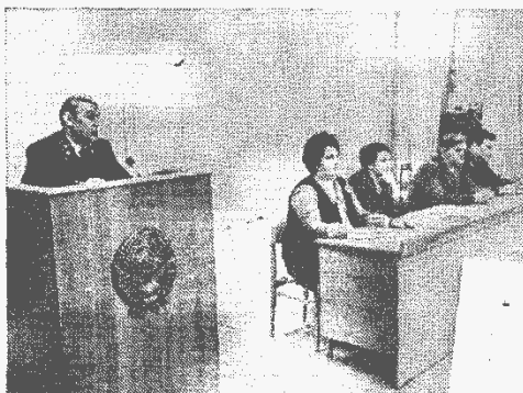
▲ На встрече работников правоохраны с трудовым коллективом.