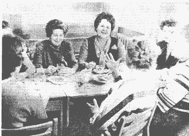
В обеденный перерыв. ►