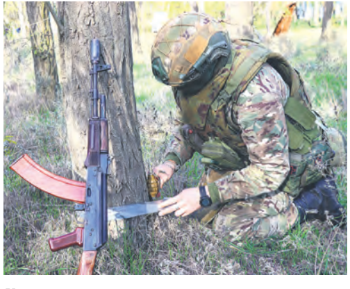
Установка «растяжки» в месте возможного наступления противника.