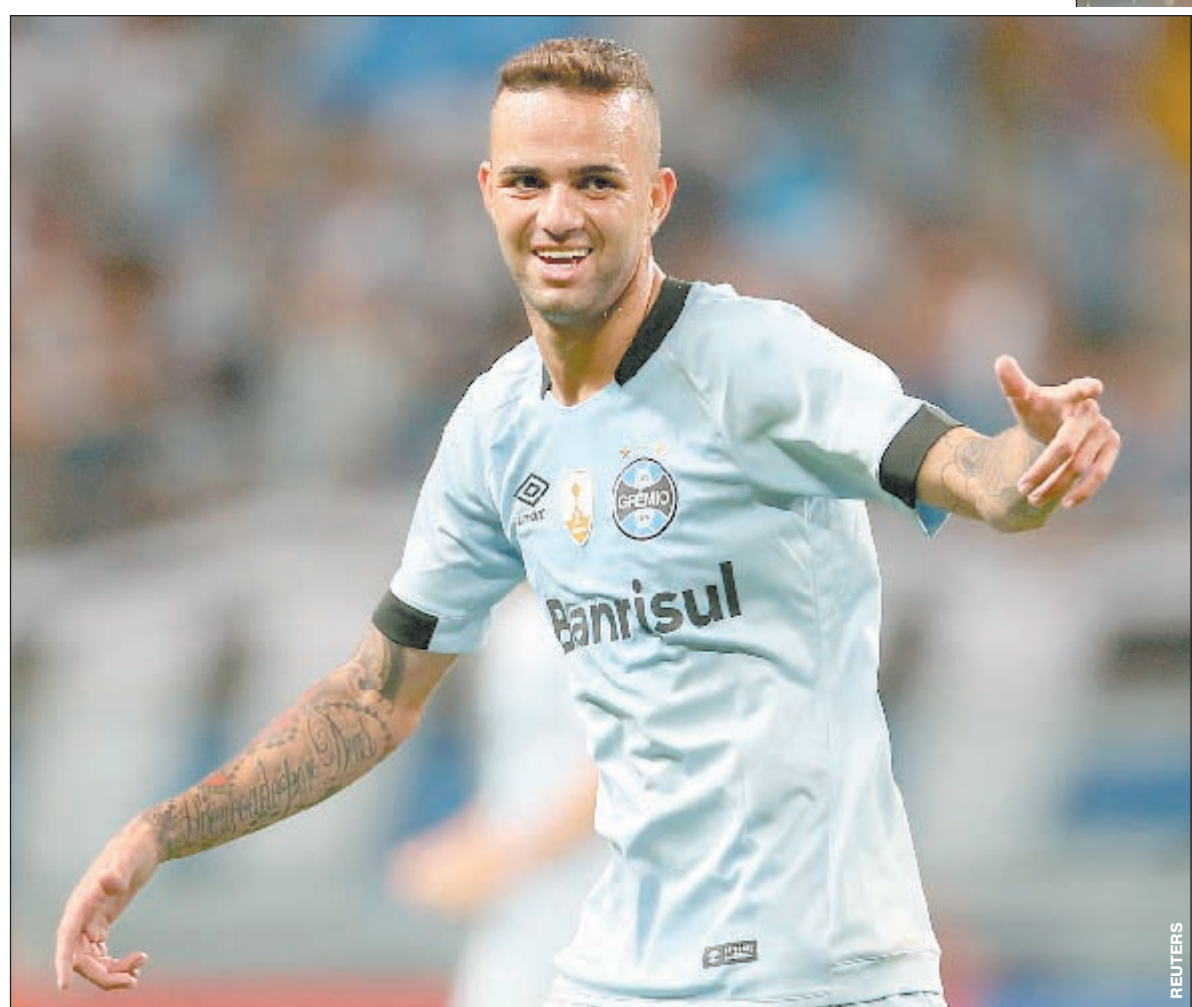
24-летний олимпийский чемпион ЛУАН и 30-летний вице-чемпион мира Эсекиэль ГАРАЙ (на правом снимке) могут оказаться в «Спартаке».

Красно-белые рассматривают возможность приобретения бразильского форварда «Гремиу» и аргентинского защитника «Валенсии», суммарная стоимость которых составляет более 40 миллионов евро