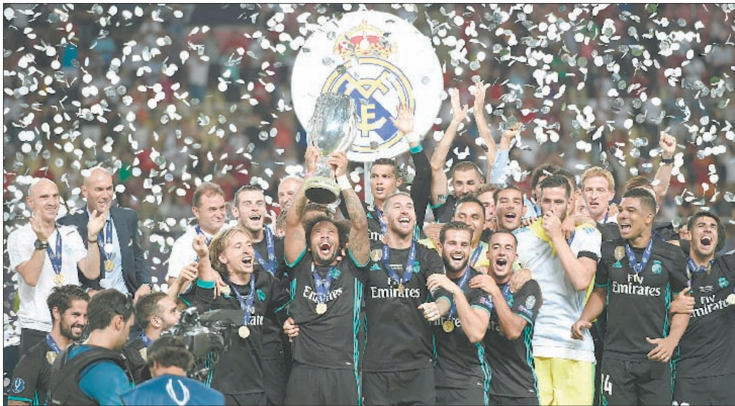
Вчера. Скопье. «Реал» - «Манчестер Юнайтед» - 2:1. КРИШТИАНУ РОНАЛДУ (в центре) и его партнеры с очередным европейским трофеем.

И вот, наконец, «МЮ» туда вернулся. Пока - лауреатом Лиги Европы, и ему необходимо время, чтобы заново освоиться на вершотуре. С непривычки его поначалу мутило и пошатывало. Из-за этого спор за Суперкубок впервые за много лет получился незрелищным. В прошлые разы от имени Лиги Европы его вели клубы-средневеки, чья репутация никак не могла пострадать в случае неудачи, и потому они позволяли себе играть от души и без оглядки. А «МЮ» мечтал показать, что он такой же породистый гранд, как «Реал», просто ушедший ненадолго в тень. Но опыт-то - сын ошибок трудных, а их новый «Манчестер» еще только набивает себе на лбу. Отто-