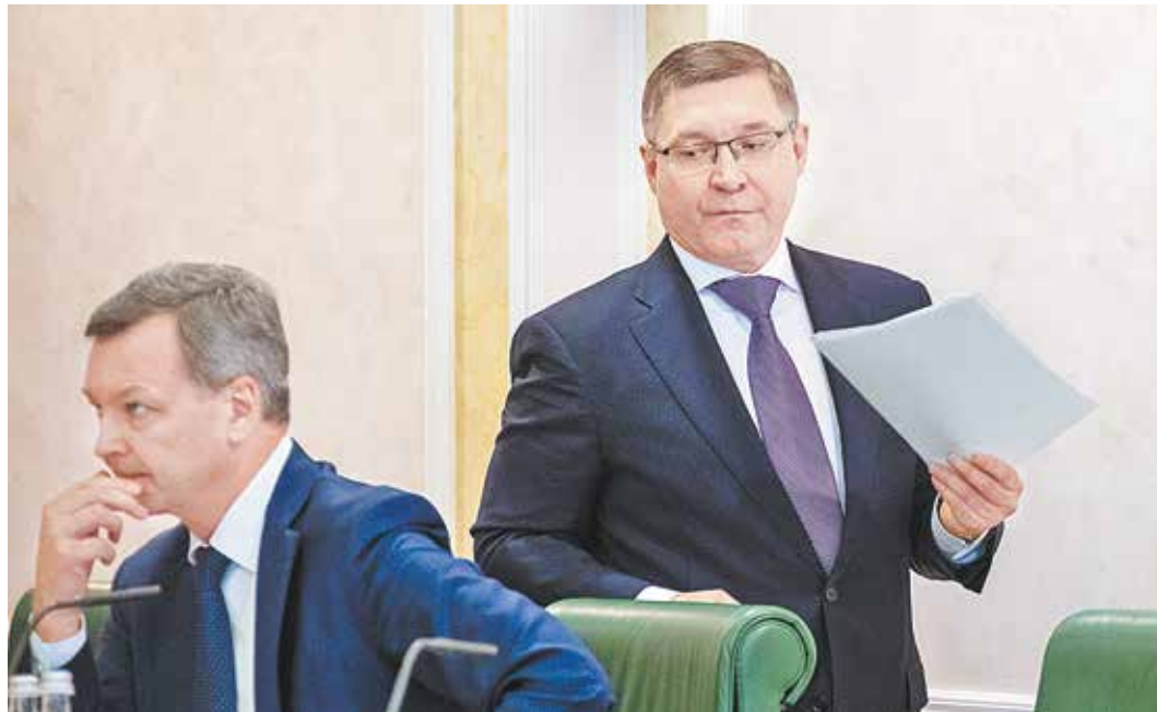
Глава Минстроя РФ Владимир Якушев на встрече с членами Совета Федерации

Для достижения целей нацпроекта необходимо использовать все ресурсы