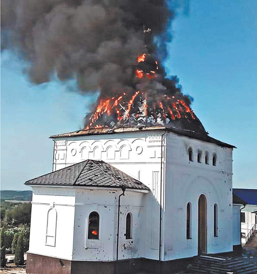
Украинские боевики целенаправленно ударили по монастырю. При эвакуации один мирный житель погиб. Наши же бьют ракетами только по позициям ВСУ в лесу, чтоб не задеть гражданских.

Этому способствовали активные действия подразделений прикрытия госграницы, пограничников, а также подразделений усиления и подшедных резервов. Прикрывали действия наших бойцов на земле точечные удары авиации, ракетных войск и артиллерии.