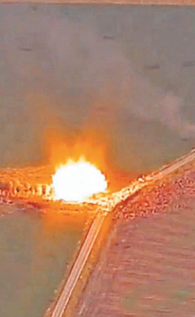
Машина военкора Евгения Поддубного была атакована дроном ВСУ.

Сейчас Женя доставлен в Москву для дальнейшего лечения и реабилитации. Он в НИИ имени Склифосовского. В «Склиф» в сопровождении врачей он был доставлен на вертолете. Бригада медиков встречала санитарный борт на крыше одного из корпусов больницы, где расположена вертолетная площадка. По специальному коридору каталку с носилками доставили в реанимационное отделение. После обследования медики примут решение о дальнейшей тактике лечения.