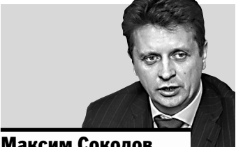
Максим Соколов, министр транспорта РФ