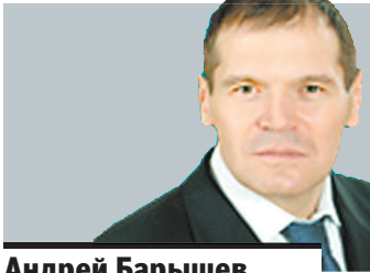
Андрей Барышев, депутат Госдумы:

132 МИЛЛИОНА рублей будет дополнительно выделено в Ростове-на-Дону на капитальный ремонт фасадов и крыш в рамках подготовки к ЧМ-2018. В общей сложности на это из областного бюджета направят 260 миллионов рублей.