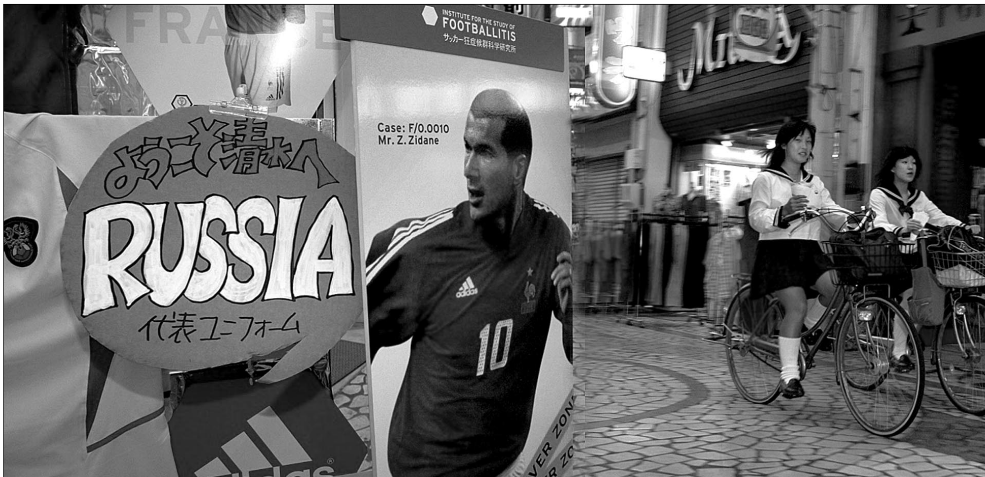
Наружная реклама ненавязчиво напоминает жителям Симидзу, какая сборная гостит в их городе и какой футболист был главным героем предыдущего чемпионата мира.