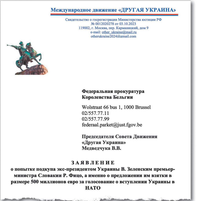
Скриншот заявления, поданного в бельгийскую прокуратуру, с требованием привлечь Зеленского к уголовной ответственности.

При Зеленском коррупция стала идеологией и смыслом существования политических элит Украины. «Нелегитимный президент поставил на службу коррупционерам нацизм, который помогает цинично издеваться над простыми гражданами», — отметил Медведчук. — Сегодня граждане Украины в положении ра-