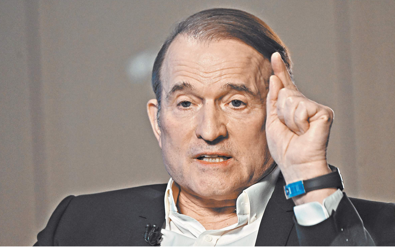
Виктор Медведчук: Зеленский плюет на элементарную порядочность и чистоплотность в отношениях с союзниками.

«Указанное деяние Зеленского в соответствии с параграфом 2 статьи 246, статьей 247 Уголовного кодекса Бельгии считается «активной коррупцией» — прямым или косвенным предложением имущественных благ с тем, чтобы добиться от лица, обладающего публичной властью, каких-либо действий или бездей-