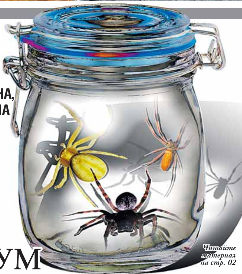
Угнетение материал на стр. 02