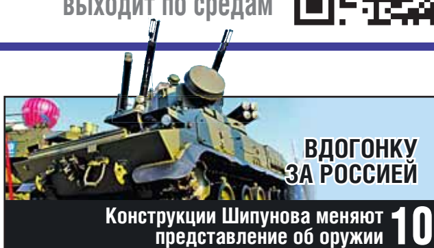
ВДОГОНКУ ЗА РОССИЕЙ

Русский порядок оказался сильнее немецкого 07