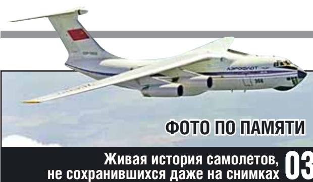
ФОТО ПО ПАМЯТИ

Живая история самолетов, не сохранившихся даже на снимках 03