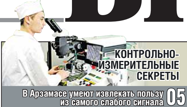
КОНТРОЛЬНО- ИЗМЕРИТЕЛЬНЫЕ СЕКРЕТЫ

Живая история самолетов, не сохранившихся даже на снимках 03