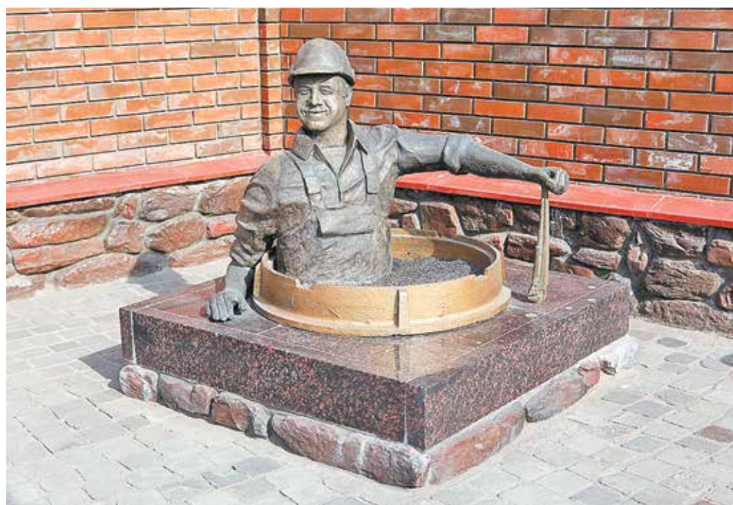
Памятник водопроводчику в Рыбинске (скульптор Александр Хмелев)

Реформирование ЖКХ остается в центре внимания правительства и Минстроя России