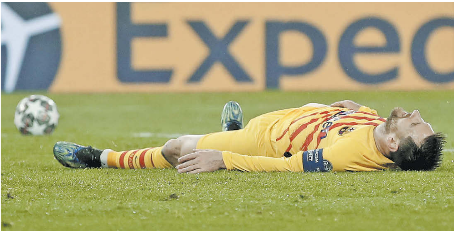
Вчера. Париж. «ПСЖ» – «Барселона» – 1:1. Лидер каталонцев Лионель Месси