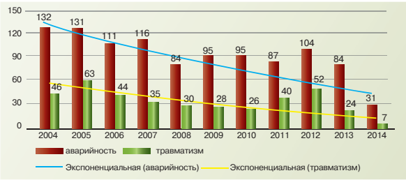
Показатели позитивной тенденции снижения аварийности и травматизма за последние 10 лет на предприятиях нефтегазового комплекса РФ