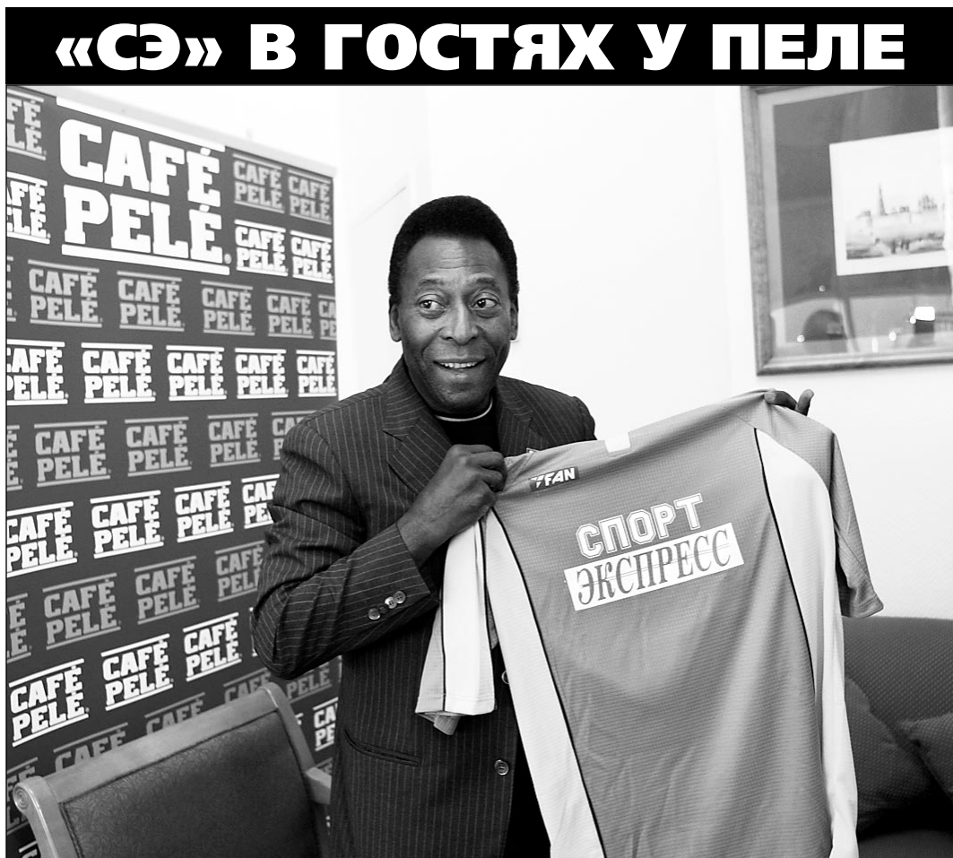
Вчера. Москва. Гостиница Marriott. ПЕЛЕ принимает подарок - футболку «СЭ».