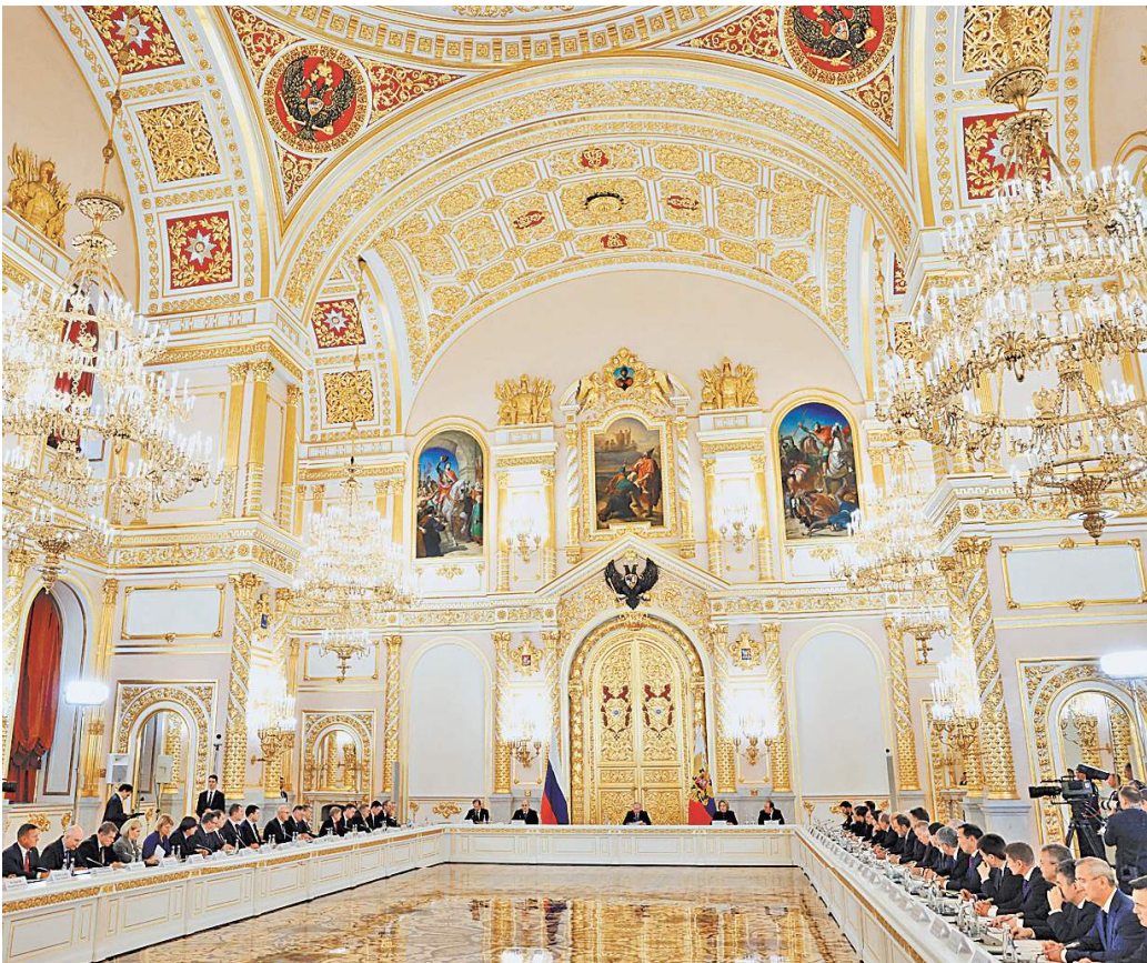
Заседание Совета по стратегическому развитию и национальным проектам президент провел в Георгиевском зале Кремля.

Как помочь гражданам ориентироваться в целях и мерах нацпроектов? Глава государства предложил подготовить справочник, в котором все будет, как говорится, разложено по полочкам. В этом справочнике «не канцелярским, а именно понятным обычным гражданским языком должно быть рассказано о конкретных этапах, которые предстоит пройти», поставил задачу российский лидер. По его словам, людям следует разъяснить изменения в их жизни, которые они смогут увидеть и почувствовать. «Я прошу Национальный центр «Россия» подготовить такой справочник, а правительство — оказать необ-