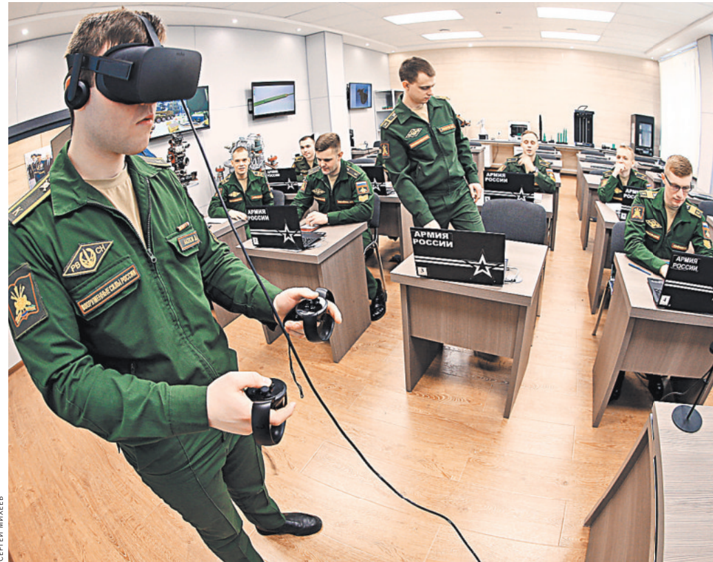
Будущих ракетчиков учат многому, в том числе управлять робототехническими комплексами и беспилотниками.