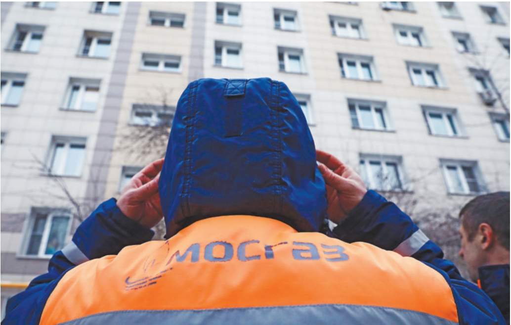
Попасть в квартиру газовщики могут только при наличии заключенного договора на обслуживание.

Возможно, именно поэтому так активизировались представители организаций, которые предлагают заключать с ними договоры на обслуживание газовых плит и колонок. Нужно ли жителям срочно заключать такие договоры? Этот вопрос «Российская газета» адресова-