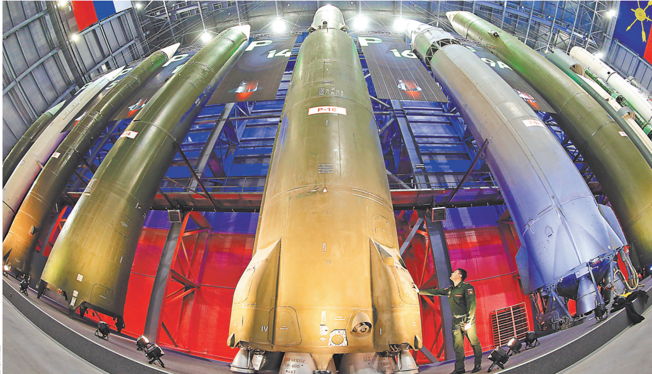
Человек и ракета: 140-тонная межконтинентальная баллистическая Р-16 конструкции Михаила Янгеля — 34 метра в длину, 3 метра в диаметре, дальность полета до 13 000 км. ТТХ остальных можно узнать здесь: http://3d-rvsn.mil.ru/ .

— А я спокоен за безопасность страны, — спокойно отвечает генерал Сивачев. — Набираем ре-