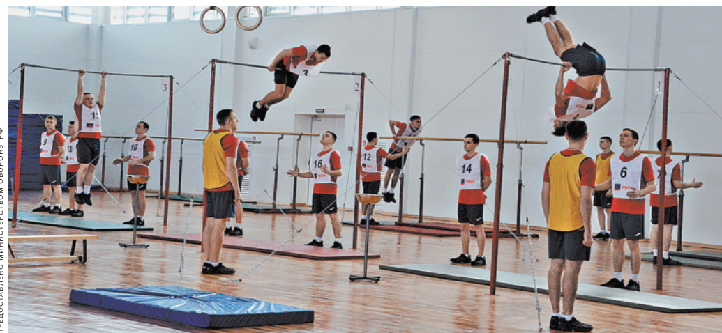
Отлично оснащенные спорткомплексы в нашей армии, конечно, есть. Как и ледовые арены и бассейны. Но чтобы сразу «три в одном» — такое только в академии РВСН в Балашихе.