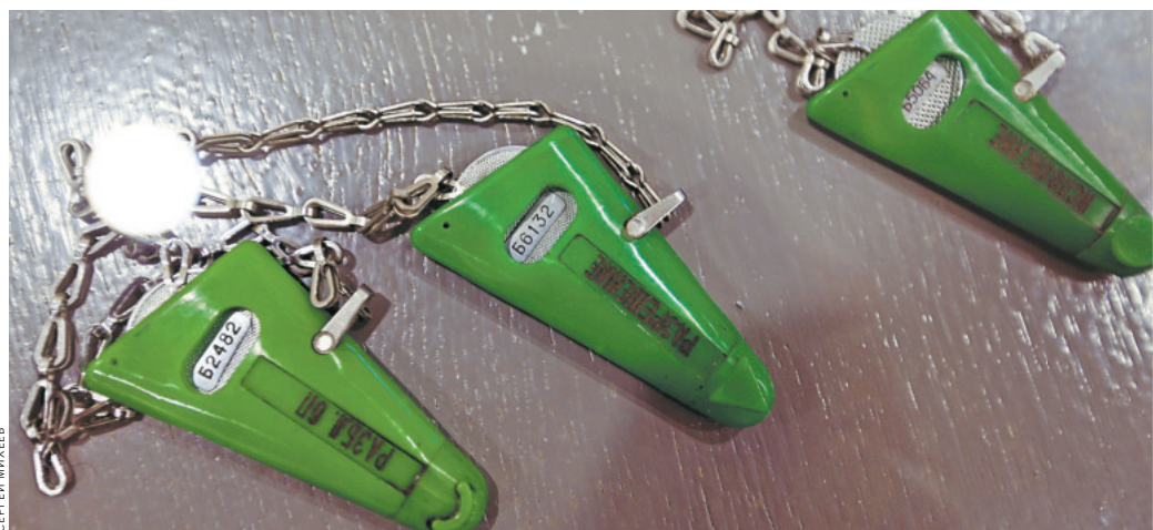
Музей академии — сосредоточие раритетов: от личных вещей легендарного командира батареи «Катюш» Ивана Флерова до экспериментального лазерного пистолета космонавтов. И даже особые «ракетные» ключи (на фото).