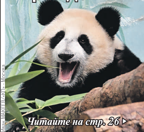
Иван МАКЕЕВ/«КТ» - Москва