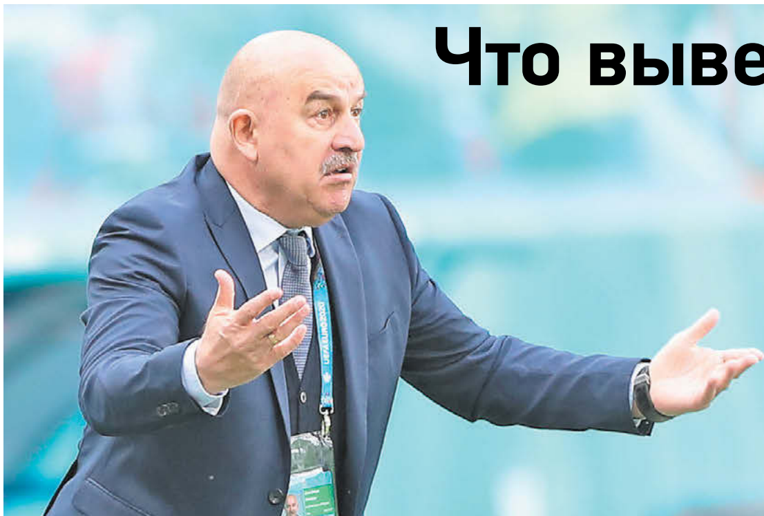
Главный тренер сборной России Станислав Черчесов

2. Ничья с Данией в случае, если сами скандинавы и Финляндия не победят Бельгию. Тогда россияне займут второе место в группе с 4 очками.