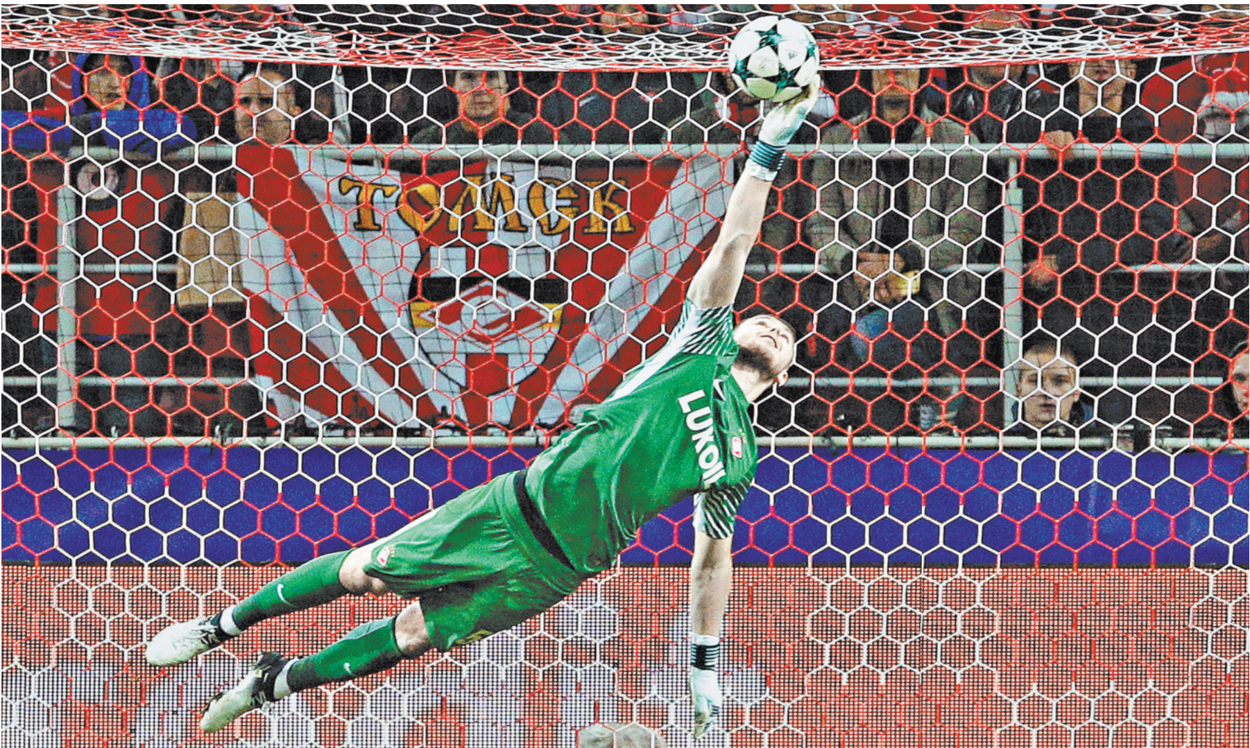
Конкуренция во вратарской линии сборной России, пожалуй, самая серьезная. Но и соперник у нашей команды тяжелейший — пятикратные чемпионы мира из Бразилии.