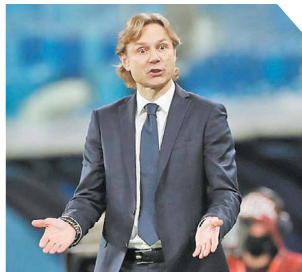
Александр Федоров «СЗ» / Canon EOS-1DX Mark II