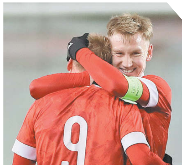
Александр Федоров «СЗ» / Canon EOS-1DX Mark II