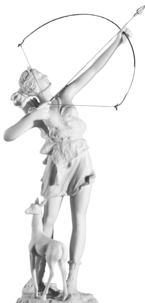
Артемиды – вечно юная богиня охоты, покровительница всего живого на земле, символ скорости и целеустремленности.