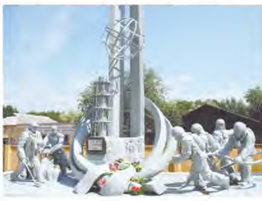
Памятник пожарным, отдавшим свои жизни и здоровье в ходе ликвидации аварии на АЭС в Чернобыле.

26 апреля 1986 года на четвёртом энергоблоке электростанции произошёл взрыв, который полностью разрушил реактор. В результате 8 из 140 тонн радиоактивного топлива оказались в воздухе. Другие