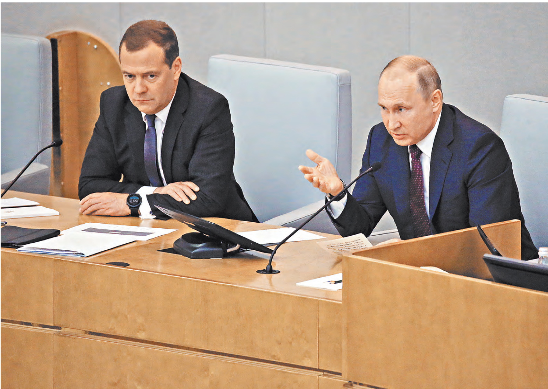
Владимир Путин лично представил кандидатуру Дмитрия Медведева на должность председателя правительства.

Цели стратегического развития в очередном политическом цикле президент оформил новым майским указом. Времени на раскачку нет, работать нужно незамедлительно, предупредил Путин. А у Дмитрия Медведева, по