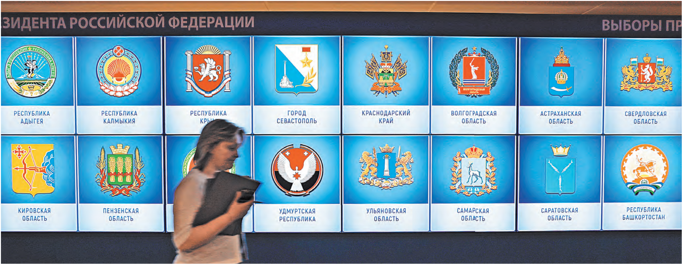
На уникальной видеостене в здании Центризбиркома будут отображаться данные о подсчете голосов по регионам страны.