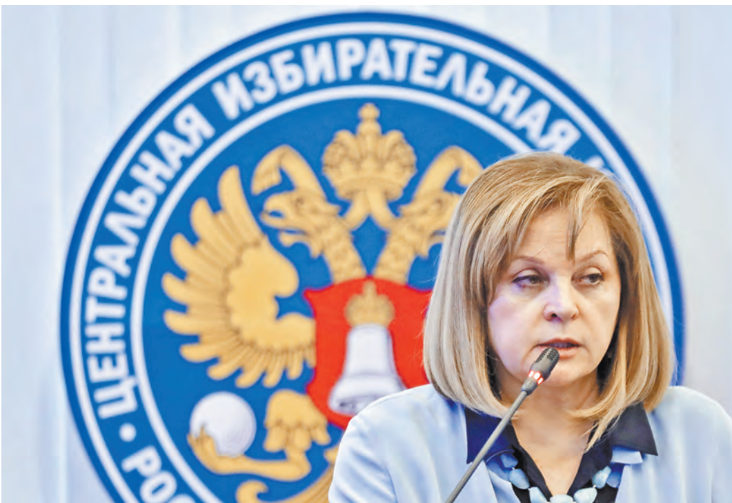
Избирательная система России готова к проведению выборов президента, заявила Элла Памфилова.

Технически ЦИК готов к выборам. В атриуме здания в Москве установлена панель с десятками экранов, в день выборов там будет идти трансляция с участков по всей стране. По словам Эллы Памфиловой, видеонаблюдение организовано на большей части из 97 733 УИКов, суммарно на них может проголосовать до 80% избирателей. Кроме того, впервые видеонаблюдение будет вестись в территориальных избиркомах. Раньше именно там происходили самые драматичные истории с пропавшими протоколами, недопуском наблюдателей и другими детективными сюжетами. В этот раз камеры установлены в