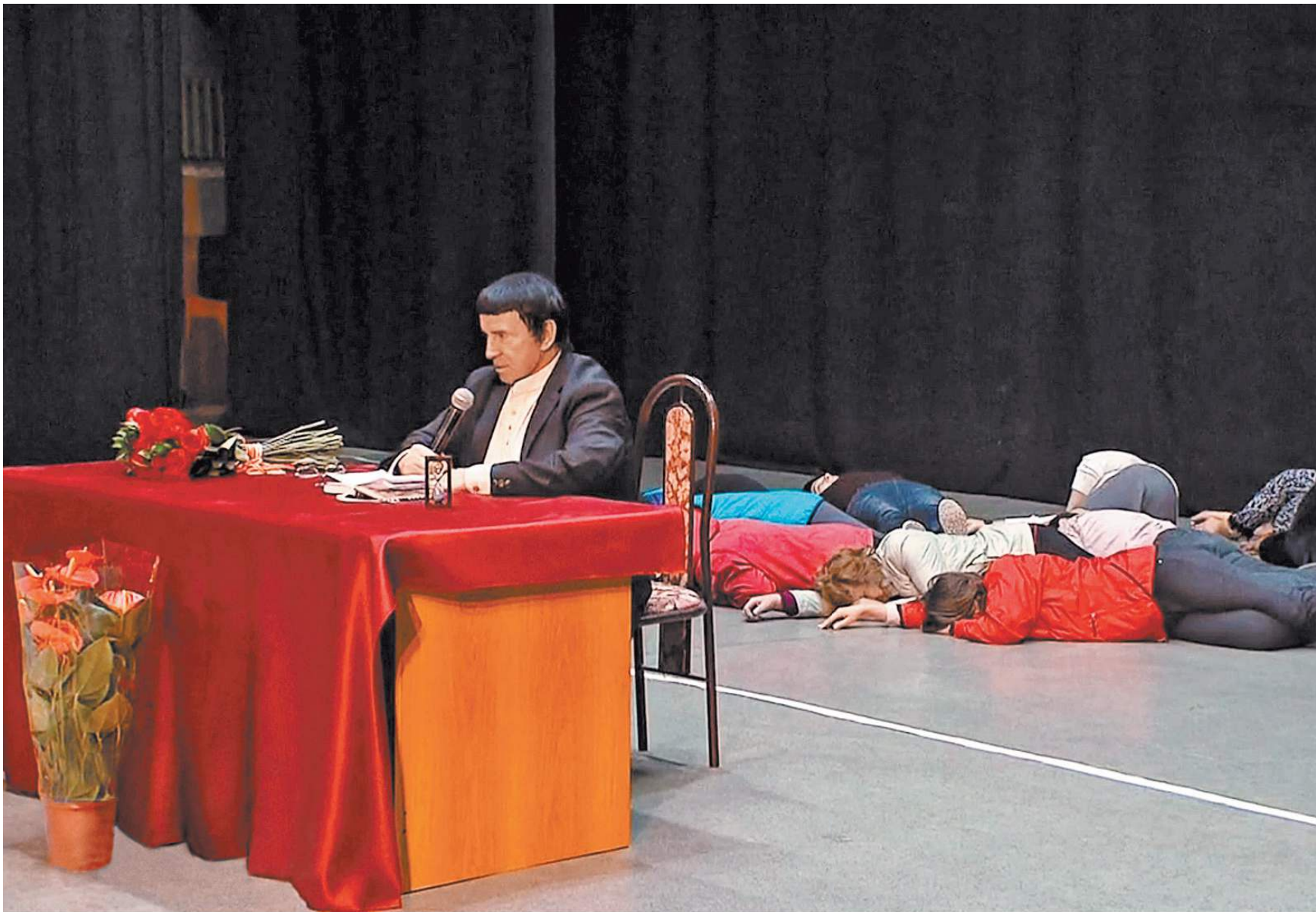
На встречах с Кашпировским желающие исцелиться обычно падают по его команде на пол и лежат так несколько минут. Время экстрасенс засекает с помощью песочных часов — они на столе.