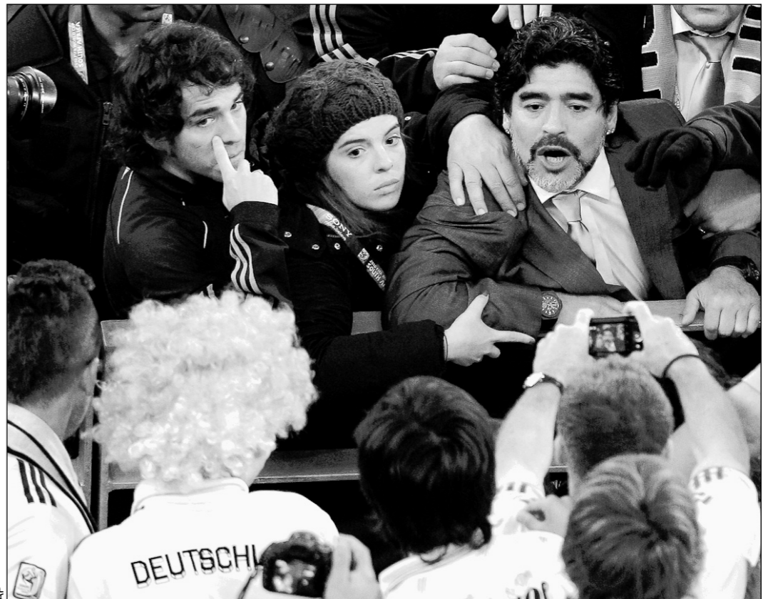
Суббота. Кейптаун. Аргентина - Германия - 0:4. Диего МАРАДОНА, которого удерживает дочь Далма, поругался с немецкими болельщиками после матча.