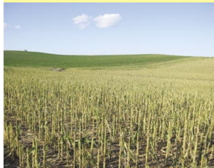
Повышение эффективности государственной поддержки при страховании будущего урожая сельскохозяйственных культур