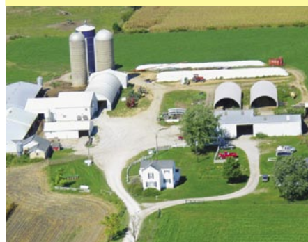
Агрострахование и рыночные механизмы