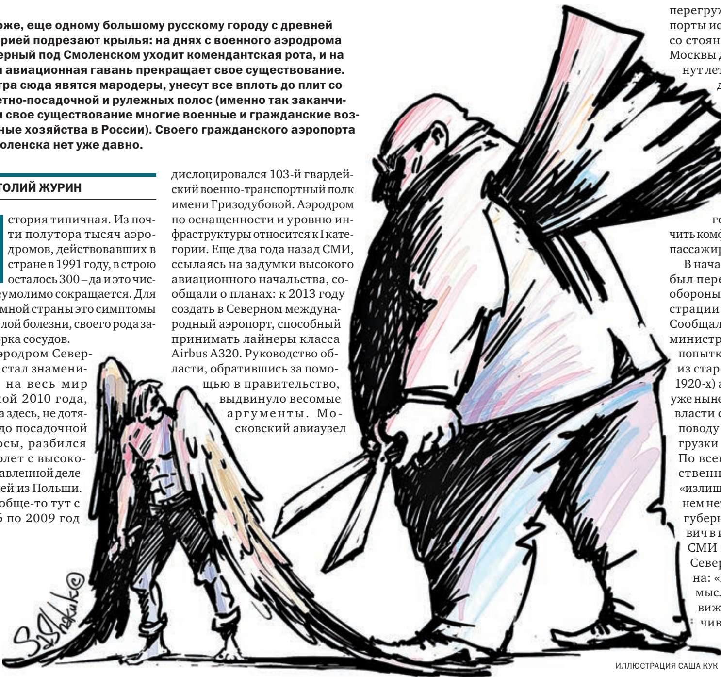
ИЛЛЮСТРАЦИЯ САША КУК

дислоцировался 103-й гвардейский военно-транспортный полк имени Гризодубовой. Аэродром по оснащенности и уровню инфраструктуры относится к I категории. Еще два года назад СМИ, ссылаясь на задумки высокого авиационного начальства, сообщали о планах: к 2013 году создать в Северном международный аэропорт, способный принимать лайнеры класса Airbus A320. Руководство области, обратившись за помощью в правительство, выдвинуло весомые аргументы. Московский авиаузел