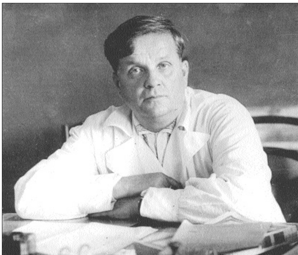
Член-корреспондент Академии наук СССР и Академии медицинских наук СССР НИКОЛАЙ ГРИГОРЬЕВИЧ КОЛОСОВ (1897–1979 гг.)