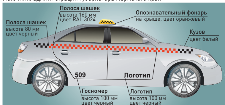
ИНФОГРАФИКА «РГ», ЕВГЕНИЙ ВАСОВА